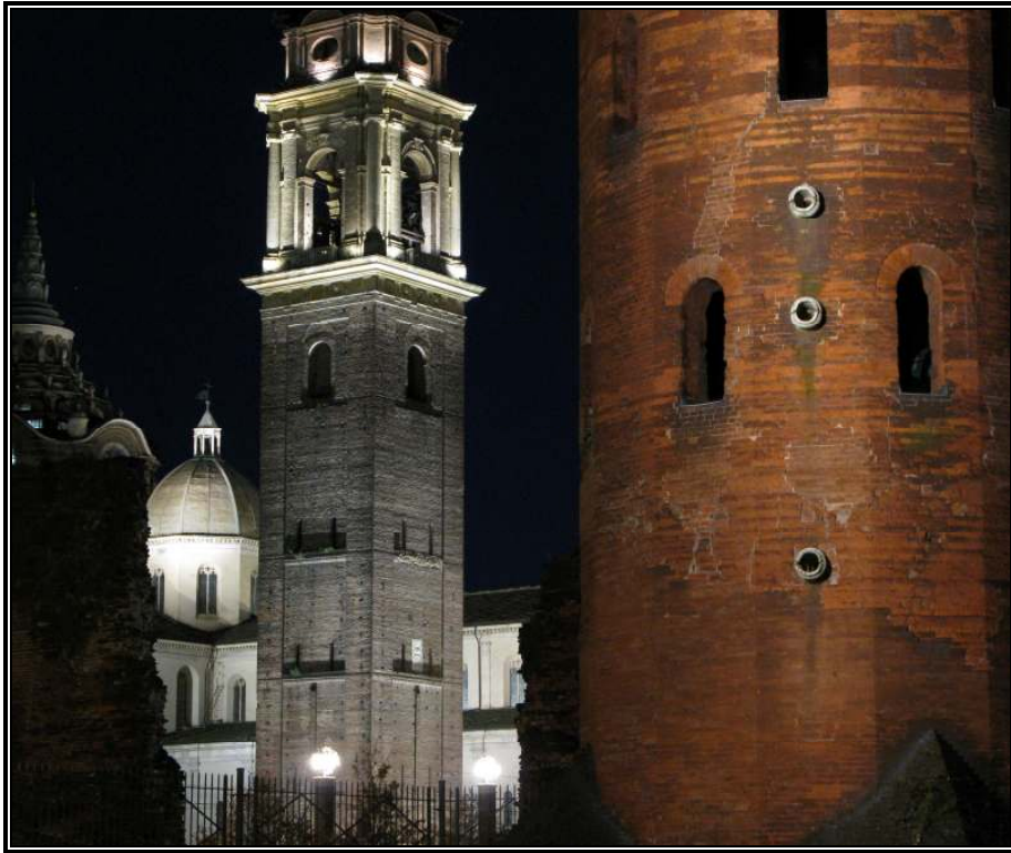
Torino- Porta Palatina