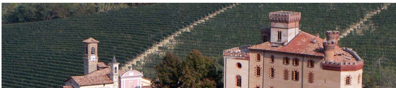
Castello di Barolo

Prima colazione e ritrovo in albergo con la guida, inizio del tour dei principali castelli e fortezze delle Langhe con auto privata o con minivan. Verranno visitati nell'ordine: Il Castello Reale di Racconigi con il suo parco, residenza di villeggiatura dei Savoia, il Castello della Manta a Saluzzo, maniero medievale dall'impianto originario del XII sec., il Castello di Barolo del X sec., circondato da un paesaggio incantevole di vigneti a