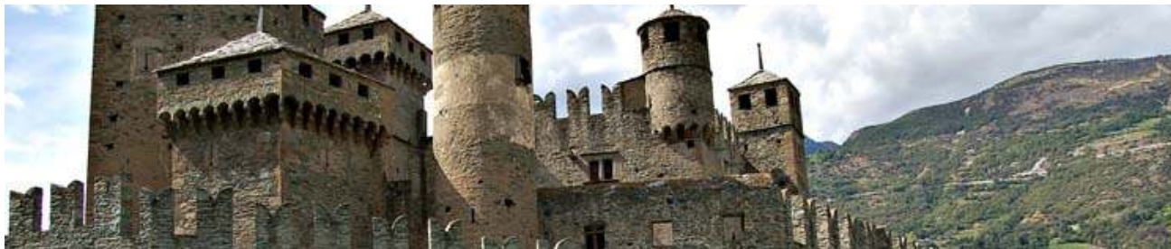
Castello di Fénis

Prima colazione e ritrovo con la guida nella hall dell'albergo, inizio del tour dei più rinomati castelli della Valle d'Aosta con auto privata o con minivan. Verranno visitati nell'ordine: Il Castello Ducale di Agliè, residenza sabauda opera del Castellamonte, il Forte di Bard, complesso fortificato di sbarramento dell'800. Pranzo in un ristorante della valle per gustare le specialità valdostane. Proseguimento verso il Castello di Fénis (visita accompagnata da una guida locale), uno dei più famosi manieri medievali della Valle d'Aosta risalente al 1300. Rientro in hotel a Torino, cena in ristorante in centro città e pernottamento.