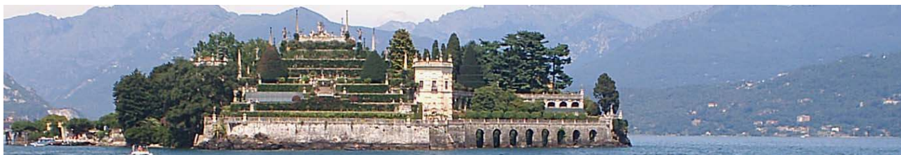
Lago Maggiore- Isola Bella

Prima colazione in albergo e trasferimento con auto o minivan privato sul Lago Maggiore. Arrivo a Verbania e gita in barca privata, accompagnati da una guida privata, alla scoperta delle famose Isole Borromeo: la pittoresca Isola dei Pescatori con i suoi stretti vicoli ed i restaurantini tipici, l'Isola Bella e l'Isola Madre con le loro nobili dimore ricche di opere d'arte. Pranzo in locale caratteristico sull'Isola dei Pescatori e rientro in barca a Verbania. Rientro in hotel e cena in un famoso ristorante stellato Michelin sul piccolo Lago di Mergozzo. Pernottamento in hotel a Verbania.