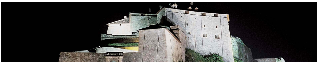
Castello di Exilles

Prima colazione e ritrovo nella hall dell'albergo con la guida ed inizio tour dei principali castelli e fortezze del Torinese con auto privata o con minivan. Verranno visitati in ordine: la Fortezza di Fenestrelle, complesso fortificato del XVIII sec., che si inerpica sulle montagna, denominato anche "la grande muraglia del Piemonte". Pranzo in valle e proseguimento per la visita del Forte di Exilles, uno dei più importanti sistemi difensivi del Piemonte risalente al VII sec., il Castello di Rivoli, costruito nel X sec e riconvertito in Museo di arte contemporanea fra i più interessanti d'Italia. Rientro in hotel a Torino, cena in ristorante in centro città e pernottamento.