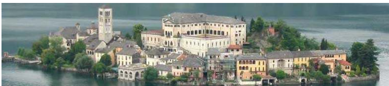
Lago d'Orta -Orta San Giulio