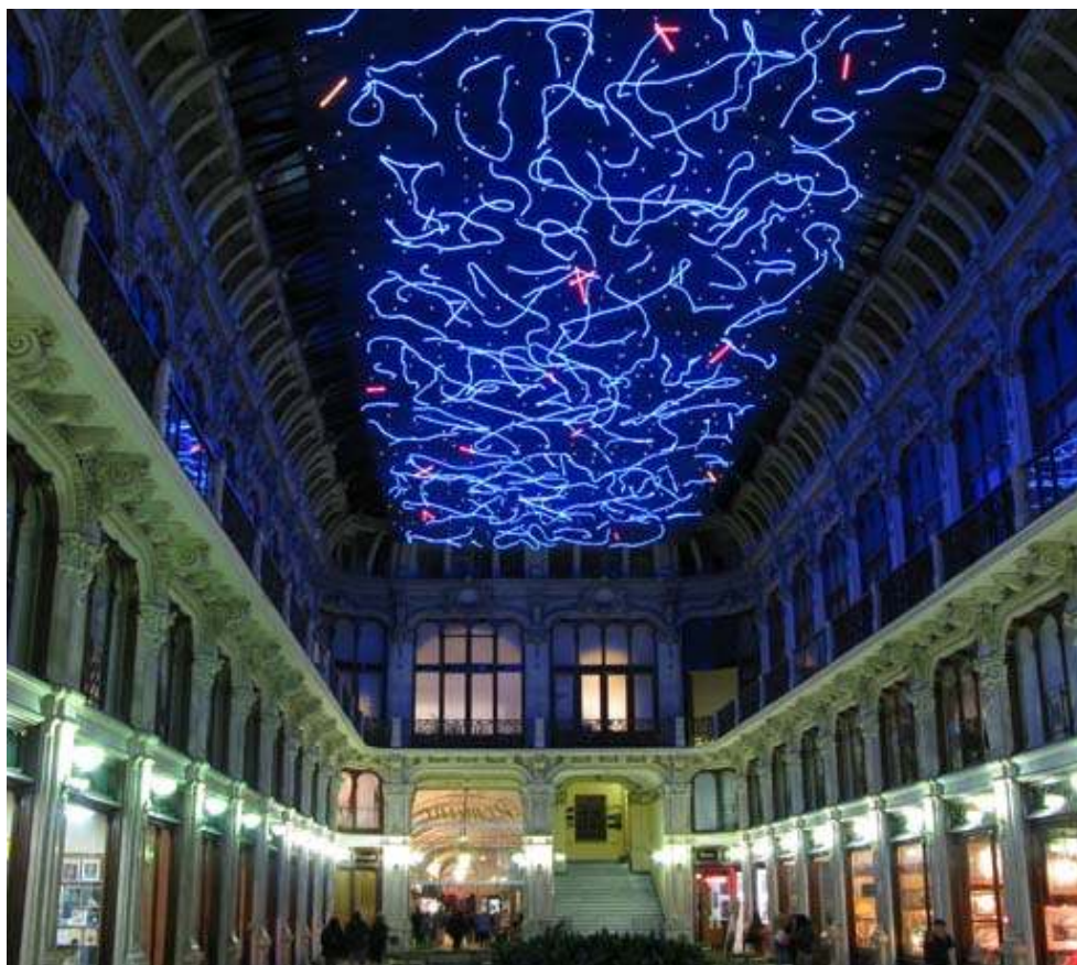
Torino – Galleria Subalpina ed arte contemporanea durante “Luci d’Artista”