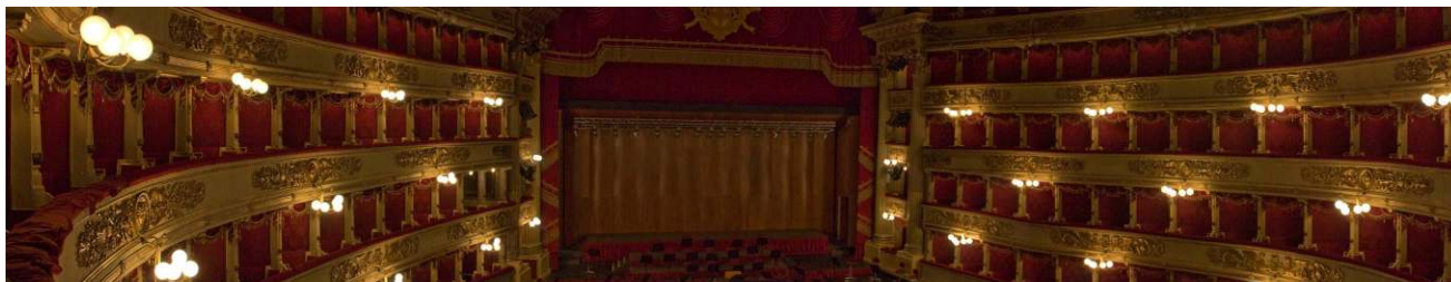
Milano – Teatro alla Scala

Prima colazione in albergo e intero giorno dedicato alla visita della città a piedi e in bus. Visita del Teatro alla Scala e del suo museo, Galleria Vittorio Emanuele e Duomo, interno e terrazze, Sant'Ambrogio, Cattedrali di San Lorenzo e Sant' Eustorgio con la Cappella Portinari, Piazza Castello. Giro panoramico della città. Visita della Pinacoteca di Brera. Rientro in hotel e cena in ristorante del centro. Pernottamento.