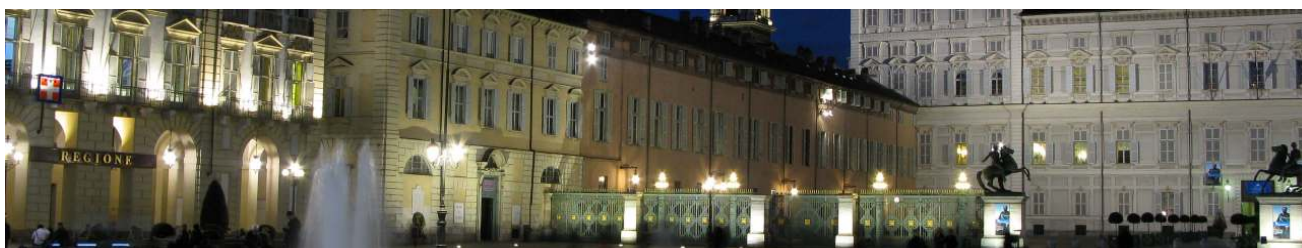
Torino-Piazza Castello e Palazzo Reale

Prima colazione in albergo e trasferimento dal Lago d'Orta a Torino in mattinata, con auto o minivan privato e sistemazione nell'hotel scelto. Incontro con la guida nella hall dell'hotel ed inizio della visita. Pranzo leggero in un bar storico. Dopo pranzo inizio della passeggiata in centro a piedi per ammirare le vie, le piazze ed i monumenti della città: la Chiesa di San Lorenzo, il Duomo, i resti romani del Teatro e la Porta Palatina, Piazza Palazzo di Città, Via Palazzo di Città, Chiesa del Corpus Domini, Via Garibaldi, Via Roma, Piazza San Carlo, Via Maria Vittoria, Via Accademia delle Scienze, Palazzo Carignano, Piazza Carlo Alberto. Rientro in albergo e cena in ristorante stellato Michelin del centro, pernottamento.