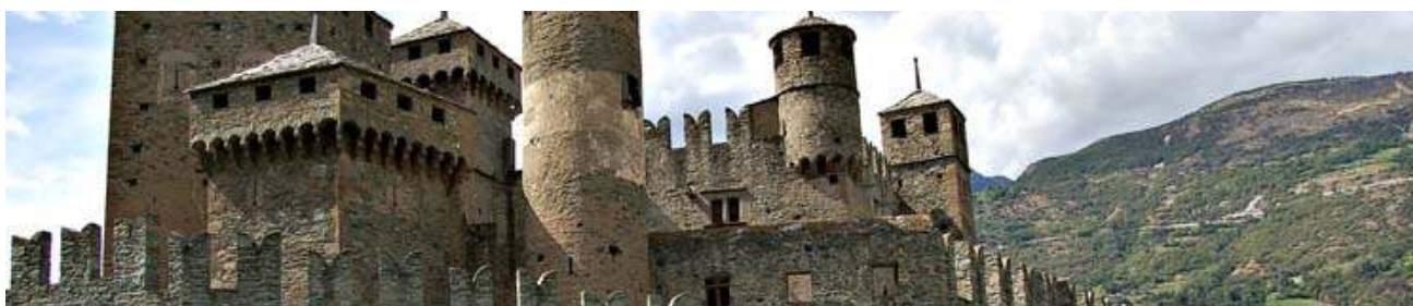
Castello di Fenis

Prima colazione e ritrovo nella hall dell'albergo con la guida ed inizio tour dei più rinomati castelli della Valle d'Aosta con auto privata o con minivan. Verranno visitati in ordine: Il Castello Ducale di Agliè, residenza sabauda opera del Castellamonte, il Forte di Bard, complesso fortificato di sbarramento dell'800. Pranzo in un ristorante della valle per gustare le specialità valdostane. Proseguimento verso il Castello di Fenis